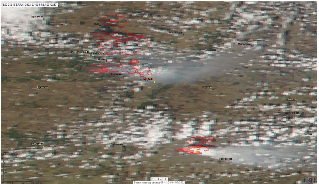
Рис. 2 Пожары и сельскохозяйственные палы в Курганской области